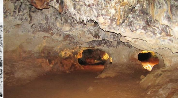
Cueba di Quadirikiri

Den Parke Nacional Arikok nos tin tres cueba: Cueba di Fonteín, Quadirikiri y Cueba di Huliba (Tunnel of Love) cu turistanan ta explora cu frecuencia. Nan ta situa na e base di e sero di calichi. Nan ta contene petroglifa Meridiano. E nombrenan ta di origin Arawak. (Petroglifa, un palabra Griego, cu ta nifica imahennan door di kita superficie di piedra door di coba of raspa pa forma un arte di piedra.